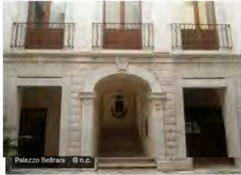
Palazzo Beltrani

Protagonista indiscussa delle vacanze degli Italiani, la Puglia si conferma tra le mete turistiche più ambite anche da milioni di turisti stranieri che ogni anno popolano le sue ridenti terre. Un primato confermato da importanti riconoscimenti internazionali: nella prestigiosa classifica dei best trips per il 2014 stilata da National Geographic, la Puglia è entrata nelle venti destinazioni al mondo da vedere assolutamente.