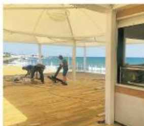
Ultimamente un architetto ha creato un chiosco con una copertura in plastica di fango. Il chiosco è stato sequestrato dalla Guardia Costiera dopo il 30 gennaio

La guardia costiera costata al proprietario la mancata rinuncia della copertura dopo il 30 gennaio è corsa al fango dell'autorizzazione