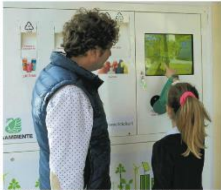
Un eco-compostatore, simile a quello che verrà installato a Mongolfiera in via Pasteur

Quella del Eco-compostatore è una iniziativa nuova e innovativa, ma che in altre città ha già trovato gli suoi sostenitori. Si tratta di rifiuti plastici che dopo aver attraversato un processo di selezione e di riciclaggio vengono convertiti in buoni spesa per effettuare acquisti nei negozi del centro commerciale Mongolfiera Pasteur, di un sistema di raccolta che incentiva i cittadini a recuperare e riciclare la plastica.